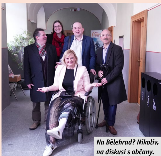
Na Bělehrad? Nikoliv, na diskusi s občany.

25. 4. Mladá Boleslav 30. 5. Slaný 27. 6. Benešov