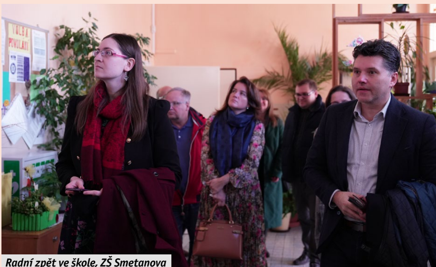
Radní zpět ve škole, ZŠ Smetanova