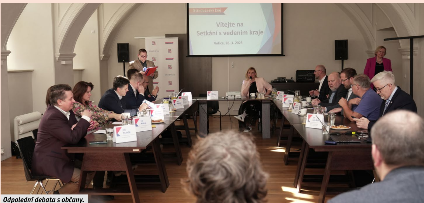
Odpolední debata s občany.