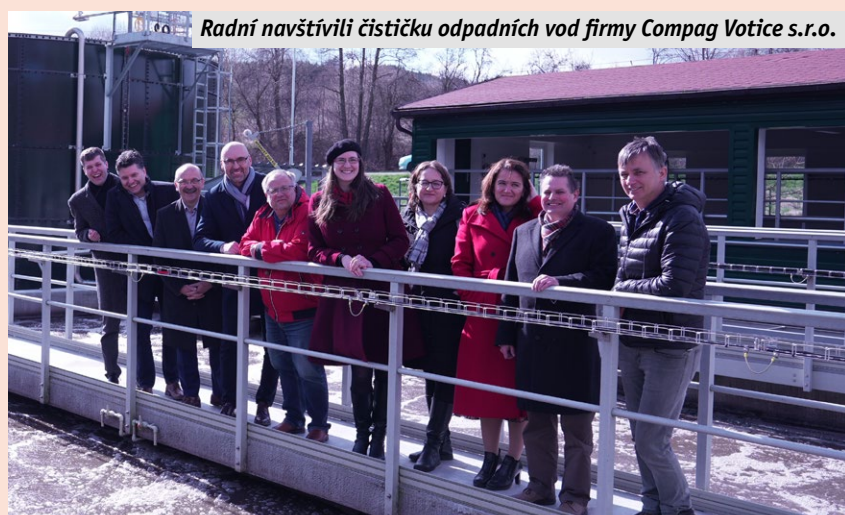
Radní navštívili čističku odpadních vod firmy Compag Votice s.r.o.