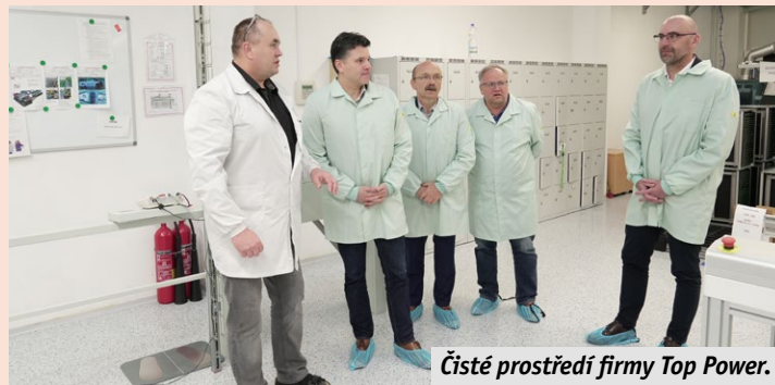
Čisté prostředí firmy Top Power.

a držet náskok před konkurencí. Třetí zastávkou krajské delegace byla společnost Compag Votice, s. r. o. Na českém trhu působí od roku 1993. Pro soukromý sektor, obce i města firma zajišťuje širokou škálu činností v oblasti komunálních služeb. Odpoledne pak patřilo občanům Votic a zástupcům okolních obcí. V refektáři sv. Františka z Assisi proběhla diskuze s občany a zástupci votické radnice.