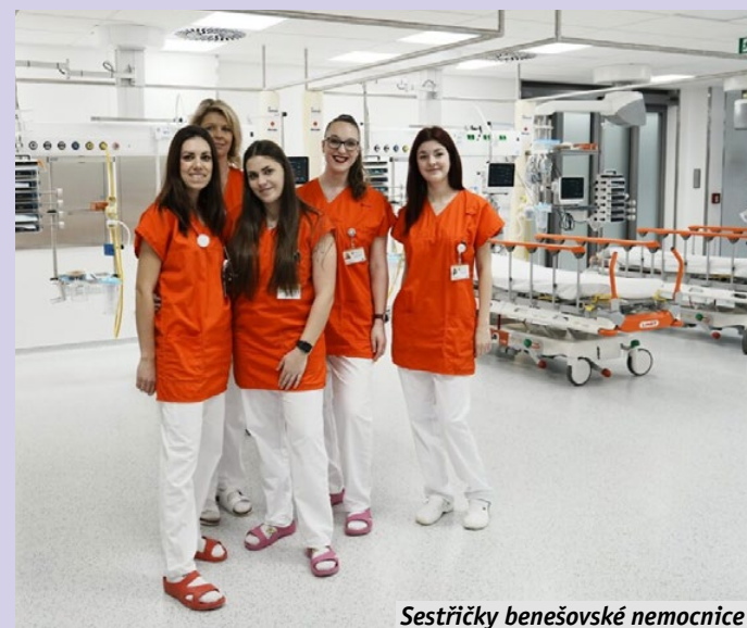
Sestřičky benešovské nemocnice

Na provozování sítě pohotovostí v letošním roce Středočeský kraj vyhradil 45 milionů korun. Pro nemocnice založené Středočeským krajem je vyčleněno zhruba 24 milionů korun, pro ostatní poskytovatele zdravotních služeb lůžkové a ambulantní formy péče na území kraje jde o 19,5 mil. Kč. Zbývajících bezmála 1,5 mil. korun zůstane zatím jako rezerva. Lékařskou pohotovostní službu ve Středočeském kraji zajišťují poskytovatelé akutní lůžkové péče, tedy nemocnice, kde jsou v případě potřeby k dispozici navazující odborná vyšetření. Výjimkou je pohotovost v oboru zubní lékařství, kde jsou služby zajištěny v rámci některých vybraných nemocnic či nasmlouvané přímo s ordinacemi. Další bezmála 33 milionů korun z krajského rozpočtu půjde na zajištění provozu protialkoholních záchytných stanic a dětského centra v Mladé Boleslavi. Jde o takzvané činnosti nehrzené z prostředků veřejného zdravotního pojištění. Z celkové částky 32,8 mil. Kč bude 8,8 mil. korun použito na pokrytí výdajů protialkoholních záchytných stanic, zbývajících 24 milionů korun je určeno na provoz Dětského centra v Oblastní nemocnici Mladá Boleslav. „Financování provozu záchytných stanic je závislé na příspěvcích kraje, potažmo na nepovinných příspěvcích obcí a na výběru poplatků za službu od klientů. Vzhledem ke skladbě klientů jsou tyto poplatky však často jen těžko vymahatelné,“ připomněl náměstek pro oblast zdravotnictví Pavel Pavlík. Středočeský kraj zajišťuje tuto službu při nemocnici