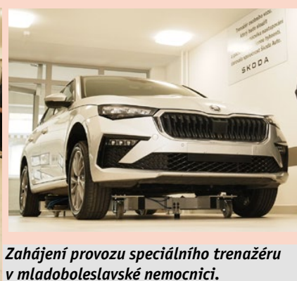
Zahájení provozu speciálního trenažeru v mladoboleslavské nemocnici.