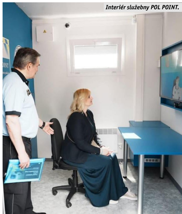
Interiér služby POL POINT.

„Přidání přehledu s POLPOINTY do aplikace Bright Sky vítám, protože každé spojení na možnost pomoci je dobré. Navíc kontakt na místa s policejní videokonferenční místností může obětem nebo svědkům pomoci k rozhodnutí ohlásit domácí násilí. Výhodou je, že nemusí chodit na policejní službu. Samozřejmě k dispozici je po získání přihlašovacích