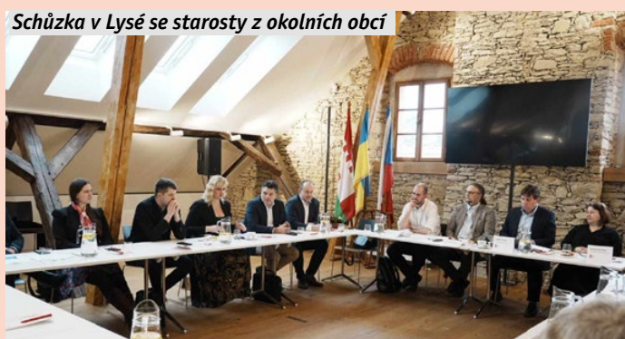
Schůzka v Lysé se starosty z okolních obcí