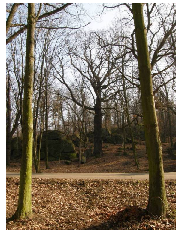
Obr. 1.1.2: Přírodní park Okolí Okoře.

Identifikace (ztotožnění se) obyvatel se svým regionem může přispět k rozvoji specificky orientované turistiky (přivedení zájemců o určité - marketingově zpracované - hodnoty a specifika území) či k podpoře určitých (regionálně specifických) odvětví zemědělství (např. plodin nebo hospodářských zvířat). K tomu bude nutná pochopitelná a kreativní komunikace s obyvatelstvem, osvěta a výchova, jak požaduje i Evropská úmluva o krajině.