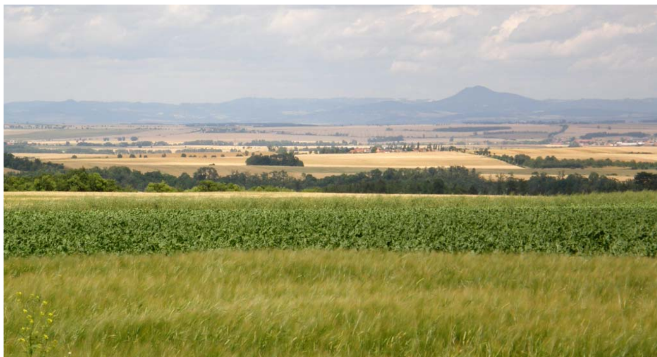
Obr. 1.2.1: Pohled z Buštěhradská směrem k severu, do Slánské tabule.

Krajina hodnoceného území má v určitých segmentech soustředěné mimořádné hodnoty přírodní, kulturně-historické a estetické, chráněné zejména v rámci CHKO Český Kras a CHKO Křivoklátsko a v rámci přírodních parků – PPa Jesenícko, PPa Povodí Kačáku, PPa Džbán, PPa Okolí Okoře. V rázu krajiny se také s proměnlivou intenzitou uplatňují znaky přírodní charakteristiky, zejména morfologie terénu (jedinečné geomorfologické a paleontologické hodnoty např. v CHKO Český kras), vegetačního krytu (obě CHKO a řada dalších MZCHÚ) a vody. Historickou krajinu Středních Čech charakterizují také četné stopy kultivace krajiny, vzniku a vývoje osídlení. Jedná se o znaky kulturní a historické charakteristiky, o vizuálně vnímané kulturní (nejčastěji architektonické) dominanty a výrazné dominantní rysy historického utváření krajiny.